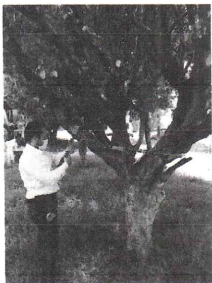
Foto 3. Se marcaron los árboles y arbustos a derribar con cintas de seguridad.